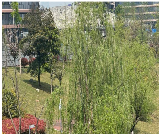
现场植被恢复情况