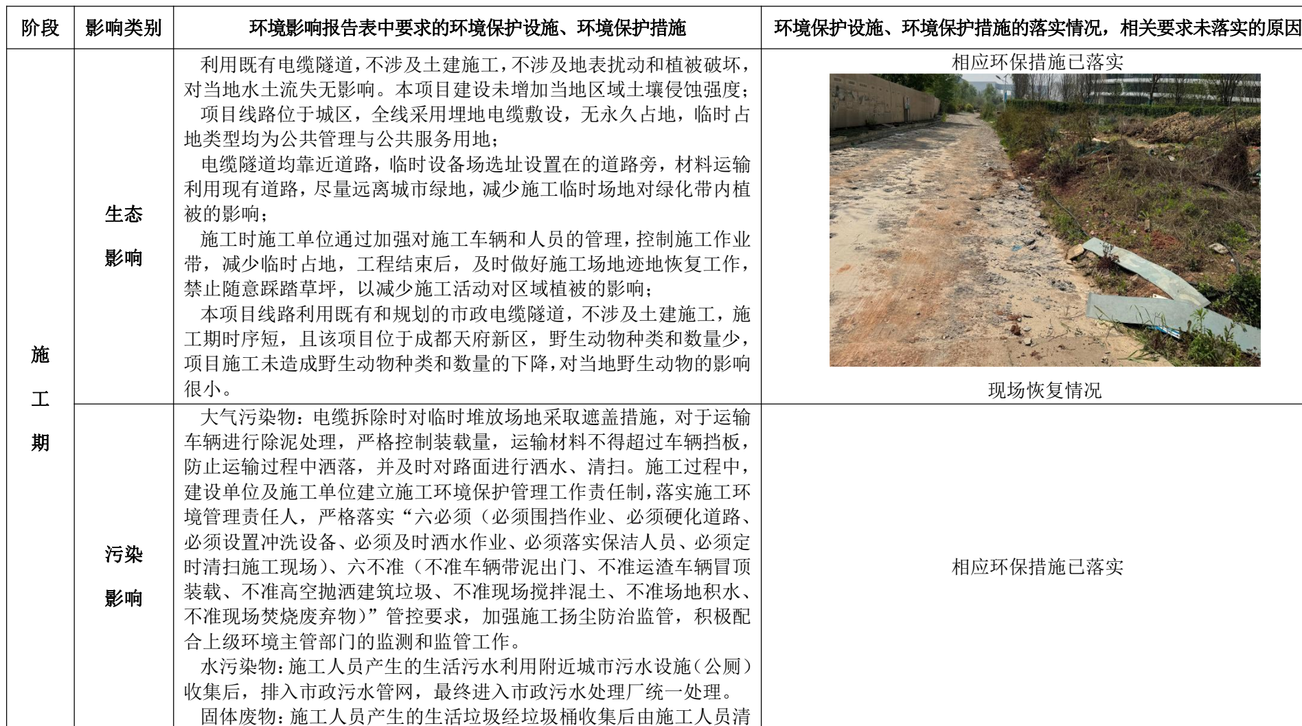
表 6-1 环评文件中提出的环保措施落实情况