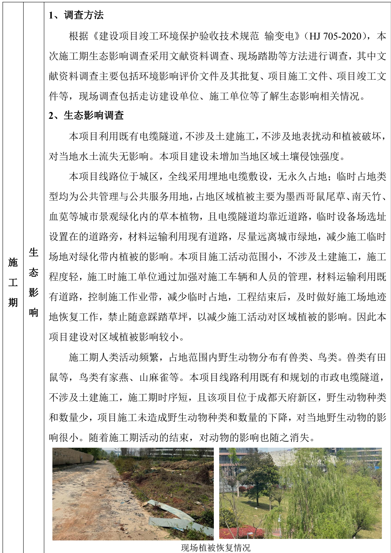
表 8 环境影响调查